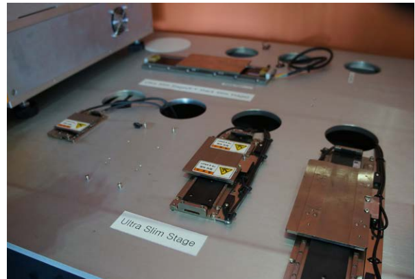
リニアモータベアリングアセンブリ

詳細については、 www.renishaw.jp/tpc-atom をご覧ください。