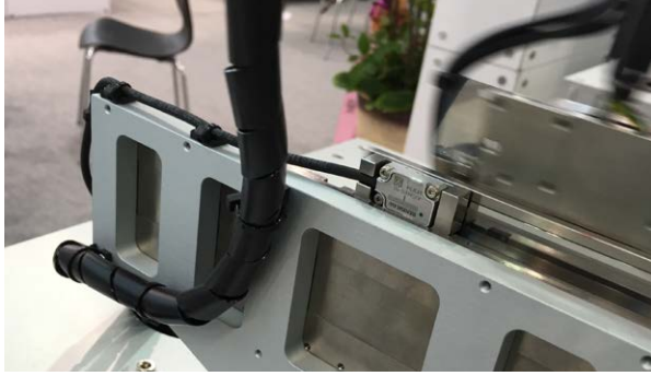
リニアモーターアセンブリ

TFT レイヤーには修復用構造が組み込まれているため、レーザーを照射することによって、不具合で白色になっているピクセルを「黒色」や「暗い色」に変換することができます。レーザーはアブレーションや溶接に使用し、不具合に焦点をあてて気化させたり TFT の修復の場合は新しい接点を作成したりします。レーザービームのスポットサイズ(直径)は、不具合を囲みつつも不具合周辺の正常な基板部分には影響を与えないようにするために慎重に制御する必要があります。パネルを正常に修復したり、生産量を向上したりするためには、レーザー開口部が直径 5~50 \mu\text{m} の範囲で正確に開閉できることが不可欠です。