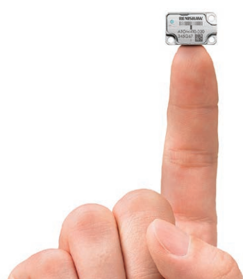
超小型エンコーダ ATOM

ATOM の超小型リードヘッドのサイズは 7.3x20.5x12.7mm (FPC ケーブル版)で、限られたスペースしかないアプリケーションに最適です。