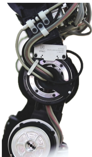
AksIM™ アブソリュートロータリーエンコーダを搭載した REEM-C の膝関節

REEM-C を始めとする PAL Robotics 社の人型ロボットは、作業に合わせて様々な複雑動作に対応する関節を備えています。そして、