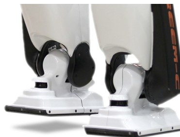
歩行中に片足でバランスを取る REEM-C

PAL Robotics 社では、バランス制御用に、各ロボットの足部にフィードバックフォースシステムを実装して、REEM-C のようなロボットの安定性評価指標であるゼロモーメントポイント (ZMP) を算出しています。その後、算出した ZMP を「ファジー論理」PD コントローラに送り、ZMP の理想値を追跡することで、バランス維持と外乱除去を実現しています。このコントローラは、ロボットの質量中心 (CoM) 位置を調整して、ZMP を常にサポート領域(脚部の下)内に維持することを目的としています。二足歩行を実現するには、位置、速度、加速度に関するロータリーエンコーダのフィードバックを利用して、脚関節の角度を的確に制御する必要があります。