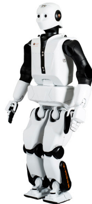
PAL Robotics 社の等身大二足歩行人型ロボット REEM-C

同社はロボットの設計からプログラミング、アセンブリまでをすべてその賑やかなバルセロナオフィスで手がけており、エンジニアたちはロボット能力の高度化に向けて常に努力しています。